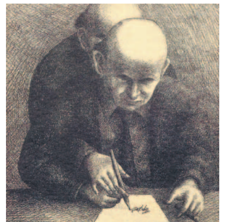
Chi agisce? Un'illustrazione di Topor

Due sono i principali campi di interesse della neuroetica: il primo si chiede che cosa è lecito fare grazie alle scoperte neuroscientifiche; il secondo che cosa dobbiamo pensare di tali scoperte. Da un lato abbiamo quindi la riflessione sulle conseguenze morali dell'applicazione delle neuroscienze — e qui si va dalla legittimità di tecniche farmacologiche e genetiche per il potenziamento di tratti mentali come l'intelligenza alla liceità della "lettura della mente" resa teoricamente possibile dalle tecniche di neuroimmagine (è legittimo negare un impiego a qualcuno perché c'è qualcosa nel suo profilo neurale che non ci convince?). Dall'altro le ricerche di neuroetica mettono in discussione le nostre idee ordinarie circa la natura dell'azione consapevole, della razionalità e persino della libertà. Secondo alcuni studiosi, le scienze del cervello ci mostrerebbero un soggetto depotenziato da una pluralità di agenzie neurali, che decidono e si orientano in base a logiche e meccanismi molto diversi da quelli che (ingenuamente) attribuiamo a noi stessi. Da questo punto di vista la domanda da porsi sarebbe non tanto «Cosa