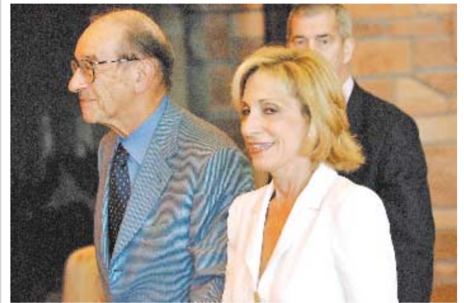
«Rischi sui mercati». Ultimo convegno annuale Fed per Alan Greenspan (nella foto Bloomberg, con la moglie Andrea Mitchell). Il governatore Usa teme una «bolla» immobiliare. A PAG. 7 e 35